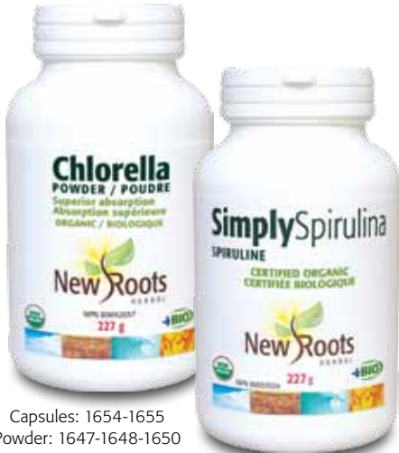
Capsules: 1654-1655 Powder: 1647-1648-1650